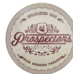
CARTEL METÁLICO PROSPECTORS LO-001

Nuestro neceser esta hecho de tela cruzada resistente, cuenta con cierre metálico y el elegante logo de prospectors en forma de diamante. Úsalo para llevar contigo tu pomada, aceite de barba, kit de afeitado, pasta de dientes, perfume, etc. Se adapta a todo. Dimensiones: 20 Largo x 13 Alto x 12 Ancho cm.