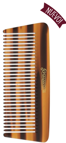
PEINETA BEARD 4.5" PE-004

Dientes gruesos hechos a mano y realmente artesanales ayudan a distribuir un producto de manera uniforme en el cabello, hecho de celulosa vegetal, no genera estática.