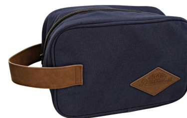
NECESER TOILETRY BAG NC-001

Nuestra cubierta evita que tus herramientas se resbalen del mesón, se mantengan lejos del suelo y en buen estado. No solo se ven geniales, sino que también te ayudan a tener tu lugar de trabajo ordenado y organizado. Dimensiones: 45 x 30 cm