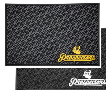
CUBIERTA NEGRO & BLANCO MT-001 NEGRO & ORO MT-002

Dientes finos y gruesos hechos a mano finamente elaborados, ayudan a distribuir un producto de manera uniforme en el cabello, ideal para llevar en el bolsillo, hecho de celulosa vegetal, no genera estática.